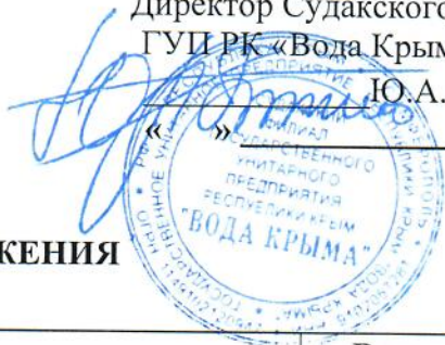
ГРАФИК ВОДОСНАБЖЕНИЯ с. Морское