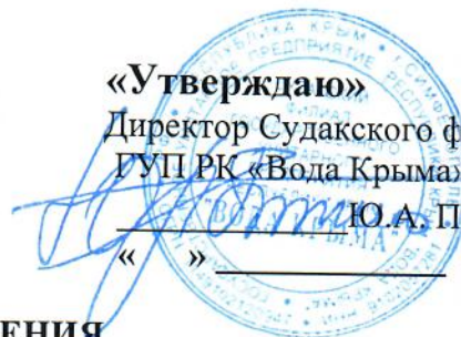
ГРАФИК ВОДОСНАБЖЕНИЯ г. СУДАКА