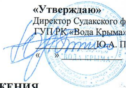
ГРАФИК ВОДОСНАБЖЕНИЯ с.Дачное