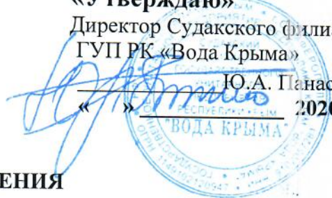
ГРАФИК ВОДОСНАБЖЕНИЯ с. Грушевка