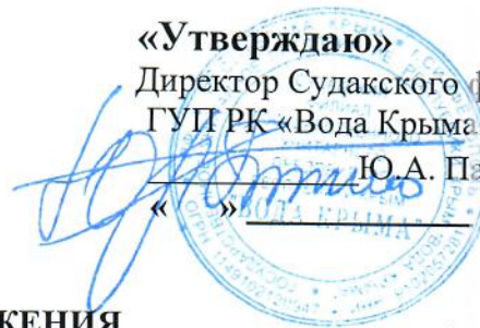
ГРАФИК ВОДОСНАБЖЕНИЯ с.Холодовка