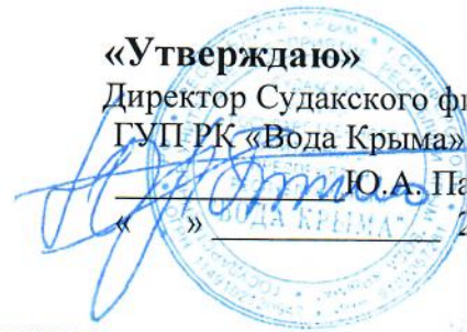
ГРАФИК ВОДОСНАБЖЕНИЯ пгт.Новый Свет