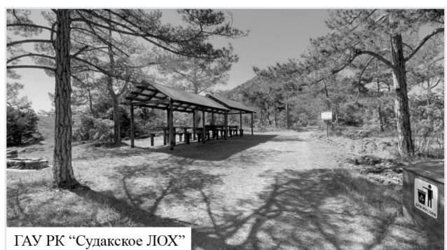
ГАУ РК «Судакское ЛОХ»

Департамент лесного хозяйства по ЮФО присвоил Республике Крым первое место в конкурсе за организацию противопожарной пропаганды.