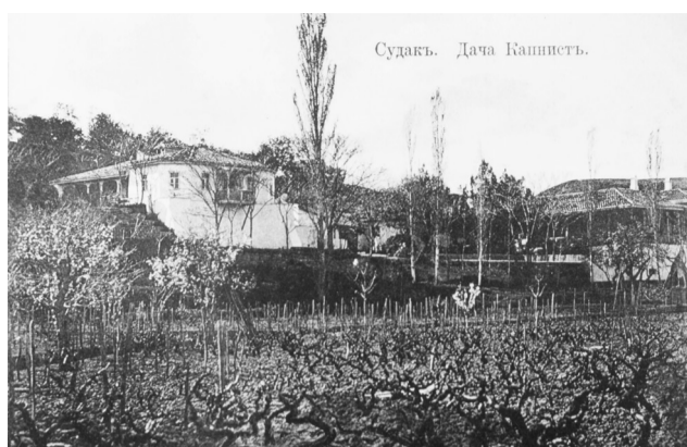
Судак. Дача Капнисты.