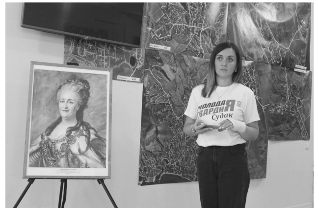
МО РВИО Судацкого ГО