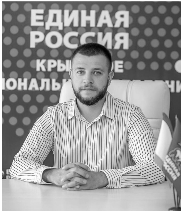
Работа во фракции «Единая Россия» в Судакском городском совете, участие в заседаниях Судакского городского совета и других рабочих органах

За период с 21.02.2023 г. по 1.10.2023 г. Судакским городским советом проведено 9 пленарных заседаний сессий, из которых 2 внеочередные. За указанный период принято 156 решений сессий, из которых 46 составляют постоянных комиссий. Повестки дня пленарных заседаний формируются совместно с председателями постоянных комиссий городского совета и главой администрации г. Судака.