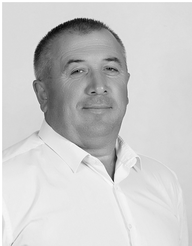
Работа с избирателями

В процессе работы на избирательном округе за данный отчетный период особое внимание уделялось как коллективным обращениям, так и индивидуальным. Всего было организовано 5 приемов граждан. По одному из обращений, совместно с Министерством информации и связи, были проведены работы по устранению провисания проводов по ул. Горной и ремонт аварийной опоры. Работа была выполнена в кратчайшие сроки. Дополнительно на регулярной основе по обращениям жителей совместно с СФ ГУП РК «Крымтелеком» ведется работа по ремонту аварийных опор и устранению провисания линий, дополнительно подготовлен