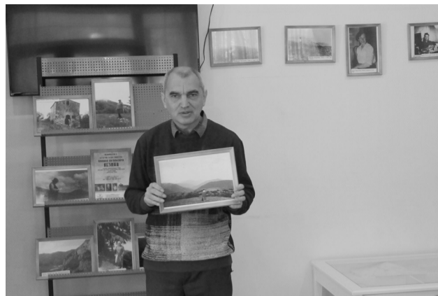
Мероприятие к 130-летию поэта Николая Васильевича Лезина

В прекрасный солнечный день уходящего 2023 г., 29 декабря, по инициативе местного отделения Российского военно-исторического общества и историко-краеведческого клуба «Связь времен» ФКУЗ «Санаторий «Сокол» МВД России» был установлен информационный стенд на стене дома известного судакского поэта, краеведа, учителя Николая Васильевича Лезина (1893-1967). Домик, некогда принадлежавший семье Лезиных, сохранился на территории «Сокола»; в настоящее время в нем находится стоматологический кабинет.