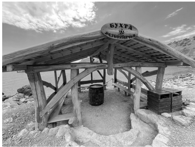
Места организованного отдыха на территории Судакского лесохозяйственного хозяйства

Многие жители и гости полуострова стремятся провести на природе свободное время, но бесконтрольное пребывание граждан в лесу нередко наносит серьезный экологический ущерб. Когда нет обустроенных мест для безопасного отдыха, граждане проводят время бесконтрольно и при этом не всегда ведут себя адекватно: разводят костры вблизи хвойных насаждений и сухой травы, а это может привести к лесному пожару; незаконно рубят лес; образуют стихийные свалки. Подобные проявления неорганизованного отдыха охватывает обширные территории, а полностью контролировать массовое посещение лесных массивов невозможно.