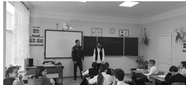
Отдел надзорной деятельности по г. Судак УНД и ПР ГУ МЧС России по Республике Крым

гражданской обороны, узнали об основных ее задачах по обеспечению защиты населения от чрезвычайных ситуаций мирного и военного времени, о порядке действий в случае возникновения чрезвычайных ситуаций, о способах и средствах защиты, о сигналах гражданской обороны и порядке действия населения при их получении. Ребята отработали навыки применения на практике средств личной защиты, правила оказания первой помощи, ознакомились с материалом, просмотрели видеоролики.