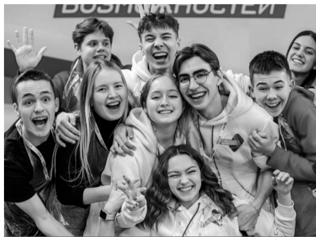
ВЛАДИМИР ПУТИН ПРЕДЛОЖИЛ ЗАПУСТИТЬ НАЦПРОЕКТ «МОЛОДЕЖЬ РОССИИ»

Тем не менее, по словам Путина, страна ни в коем случае не останется беззащитной, а, напротив, нарастит свой потенциал за счет новинок.