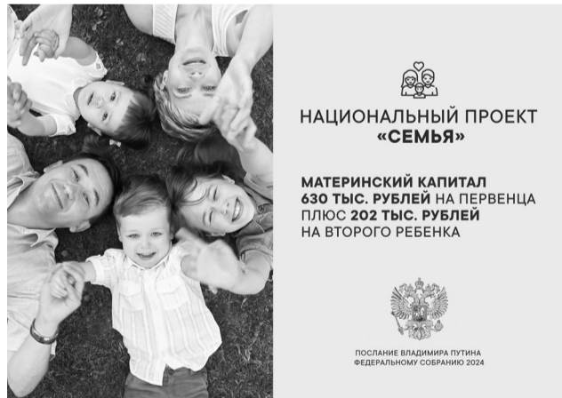
НАЦИОНАЛЬНЫЙ ПРОЕКТ «СЕМЬЯ»

Государственные и частные капиталовложения в научные исследования и разработки Путин призвал увеличить более, чем в два раза и довести их долю до 2% ВВП к 2030 г. Только бюджет выделит не менее 200 млрд. руб. на субсидирование процентных ставок для проектов по выпуску приоритетной промышленной продукции.